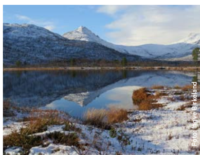
Gammel furuskog i Ånderdalen.